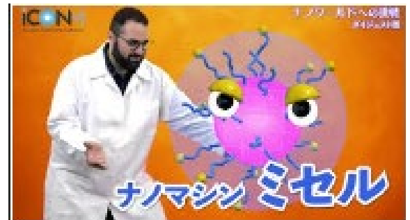
研究員によるキッズ向け研究紹介ビデオ